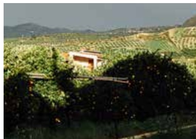
Orangefelder von L'arcobaleno

Die Erzeugergemeinschaft L'arcobaleno entstand 1993 dank der weitsichtigen und verantwortungsvollen Entscheidung einiger Landwirte. Sie entschieden sich, ihre Felder mit alten Techniken und Traditionen zu bewirtschaften, im Bewusstsein, die Gesundheit der Verbraucher und die Umwelt zu schützen.