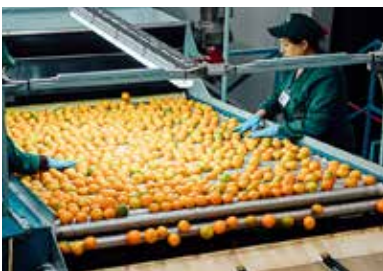
Von Hand sortiert bei Biosybaris

Die Anbauflächen liegen in der Sybarisebene in der Region Kalabrien im Süden Italiens. Hier herrscht sehr unterschiedliches Klima, welches hervorragende Voraussetzungen für ein reichhaltiges Wachstum bietet. „Qualitativ sind die Clementinen von Biosybaris unübertroffen.“