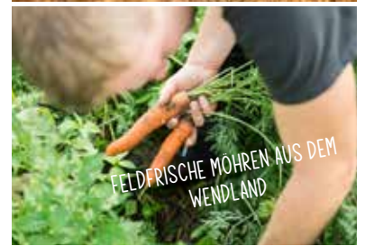
FELDFRISCHE MOHREN AUS DEM WENDLAND