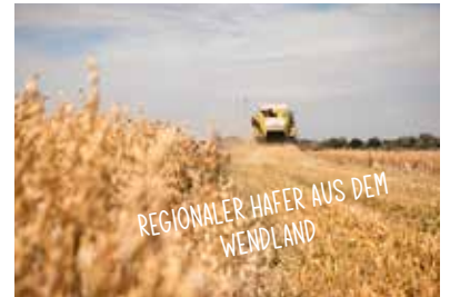
REGIONALER HAFER AUS DEM WENDLAND

Auch die Firma Voelkel ist Gemeinwohl-zertifiziert!